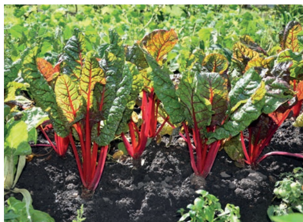
Mangold wird bei uns immer beliebter. Die zweijährige Pflanze kann gut im eigenen Garten wachsen.

Mangold war lange Zeit eine Seltenheit im Gemüse-regal. Erst in den letzten Jahren sieht man die uralte Nutzpflanze aus Vorderasien häufiger. Das kulinarische Image des Mangolds ist mindestens ebenso gut wie sein Ruf als Naturheilpflanze: Er galt schon vor Jahrhunderten als Mittel gegen Nervosität und Unruhe; auch gegen Darmträgheit setzte man ihn gerne ein. Das kalorienarme Blattgemüse, das geschmacklich an Spinat erinnert, enthält viele Mineralstoffe und punktet insbesondere durch einen hohen Anteil an Vitamin A, C, E und K. Vitamin K ist besonders wichtig für die Blutgerinnung und Knochenbildung. Das obenstehende Rezept für Pasta-Liebhaber ist daher sehr gesund, schnell gemacht und schmeckt!