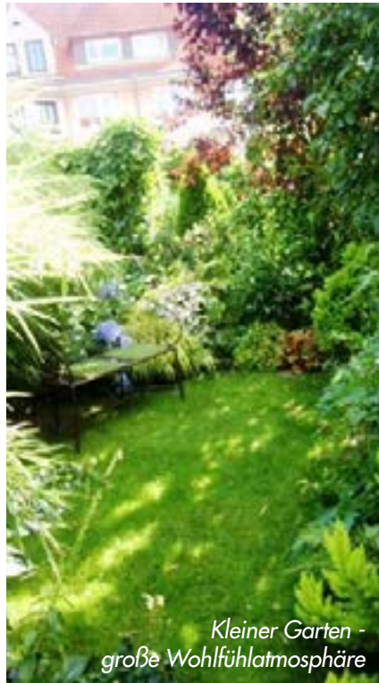
Kleiner Garten - große Wohlfühlatmosphäre

Leider wird die Pflege von einigen Mitgliedern nicht oder nicht im ausreichenden Maße durchgeführt. Ein verwilderter und stark vernachlässigter Gartenteil ist nicht nur ein Ärgernis innerhalb der eigenen Hausgemeinschaft - auch bei den Besitzern der Nachbargärten kommt es oft zu Missstimmungen, wenn sich das wuchernde Unkraut durch Wind und Vögel in der näheren Umgebung aussäet. Nicht