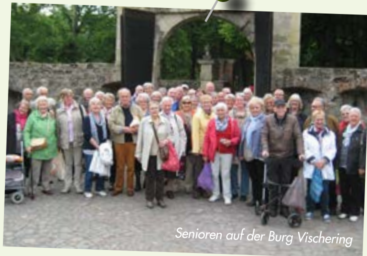
Senioren auf der Burg Vischering

Alle Senioren, die beim Wohnungsverein wohnen, sind hierzu herzlich eingeladen! Um eine vorherige Anmeldung bis zum 11.12.2015 wird gebeten.